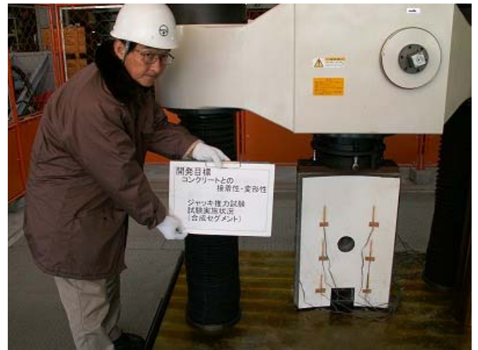
写真-7 合成セグメントジャッキ推力試験