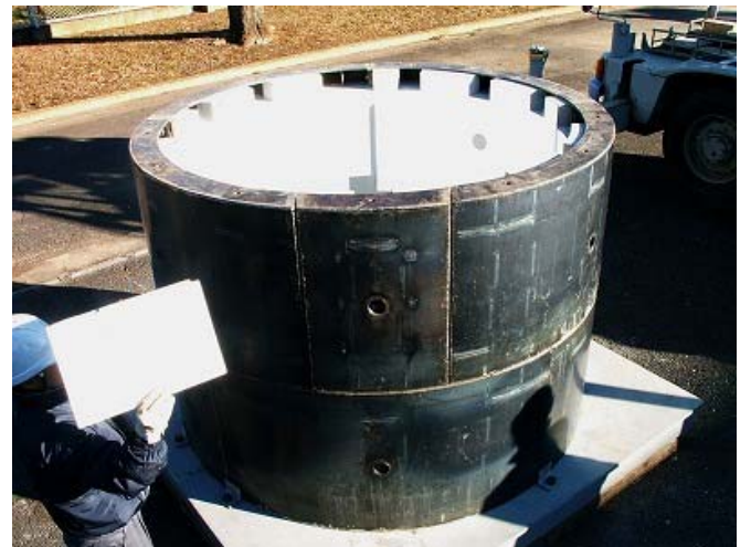
写真-5 合成セグメント組立完了