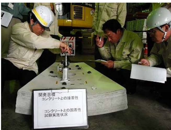
写真-10 シートとRCセグメントの固着性試験