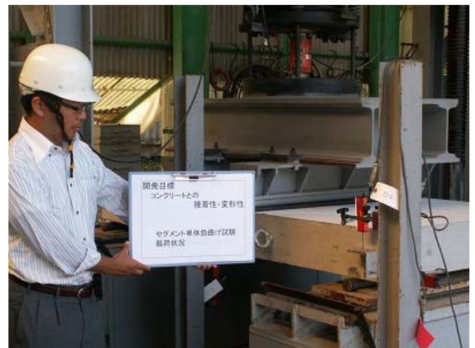
写真-9 RCセグメント単体負曲げ試験