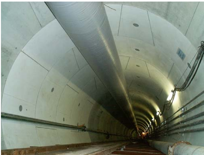
写真-4 RCセグメント組立完了（実証施工5リング）