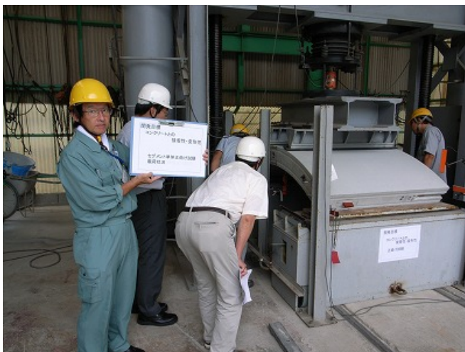
写真-8 RCセグメント単体正曲げ試験