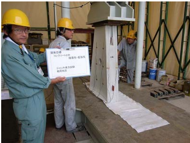
写真-6 RCセグメントジャッキ推力試験