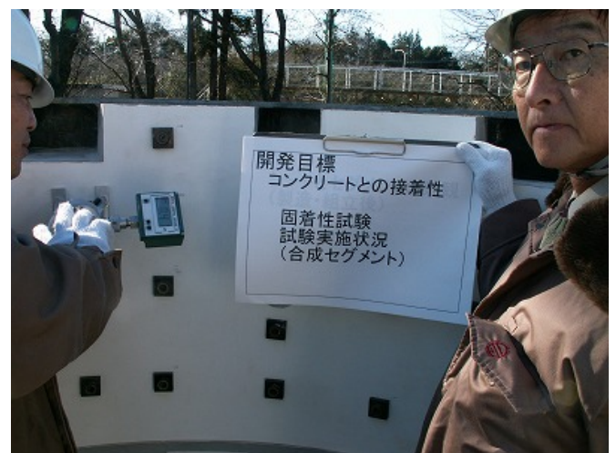
写真-11 シートと合成セグメントの固着性試験