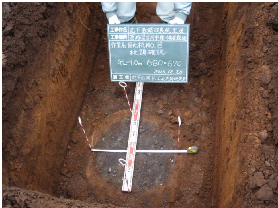
品質確認のための出来形調査