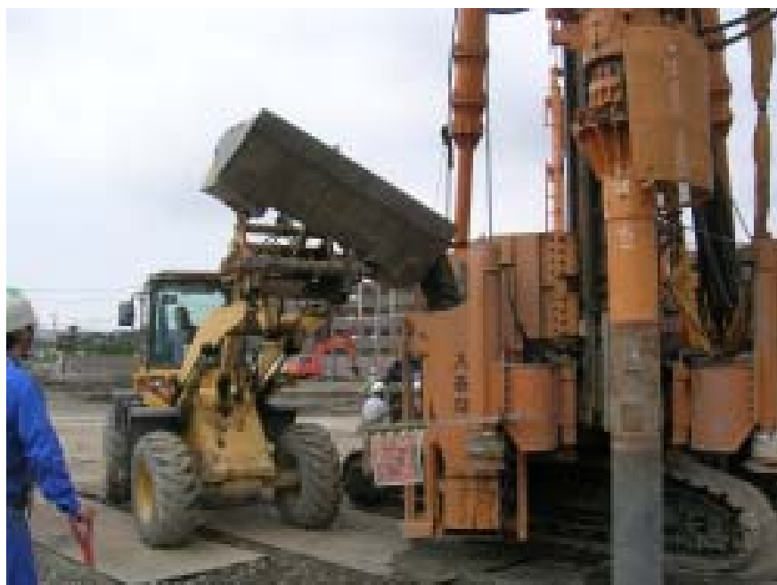
施工機械へのコンクリート投入状況