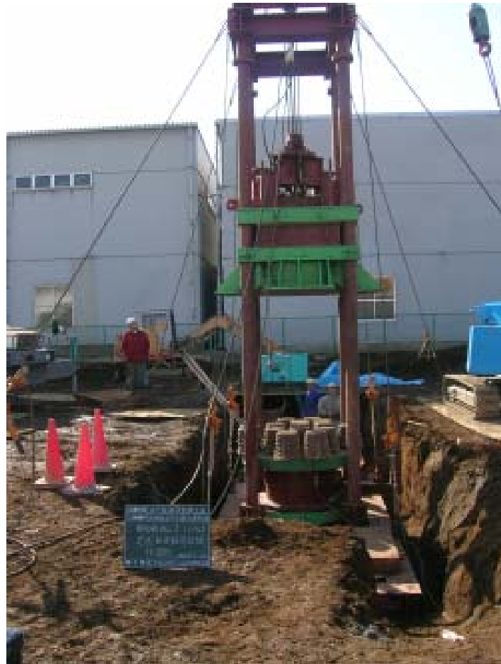
支持力確認のための載荷試験