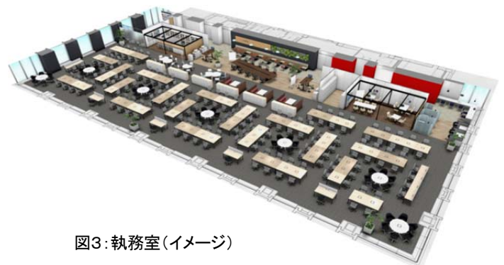
図3: 執務室(イメージ)

センシング調査や、対象者へのアンケート調査の結果を踏まえた上で、自己発働型社員のあるべき姿を捉え直し、その育成に適した効果的なICTインフラ・ツール・サービスを導入したオフィス空間を設計し、移転先の社屋で新しい働き方を試行します。