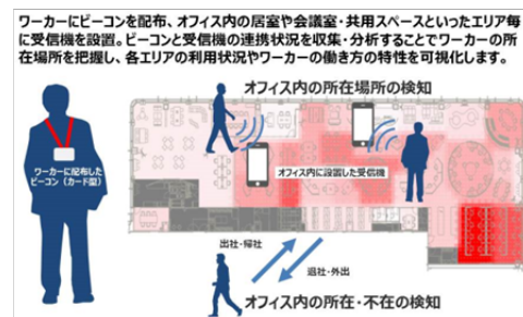
図2: センシング調査のイメージ