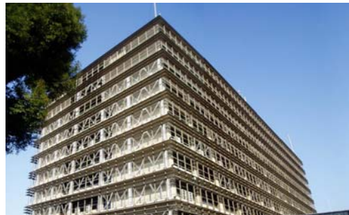
第二庁舎耐震補強完成予想図