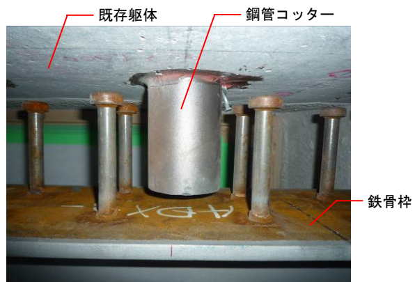
鋼管コッター接合部

今回、建物を使用しながら低騒音・低振動・少粉塵で接合部の施工が可能で、かつ工期短縮も図れる優れた工法であることが実証できました。今後は靱性が高い4階建て以上の建物については、鋼管コッターを用いたアドバンス制震システムによる耐震補強工法を積極的に提案してまいります。