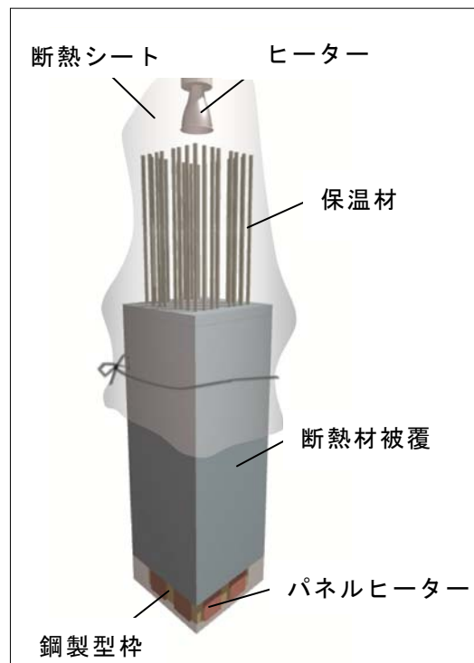
図 1 養生概念図