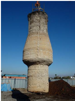
写真1 掘り出したMe-A杭（小口径）

今後開発会社各社は、杭基礎の安全性の向上とコスト低減のため、Me-A工法の適用を進めていく予定です。