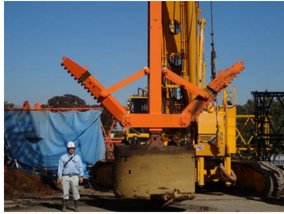
写真2 中間部拡径部の施工機械（大口径杭用）