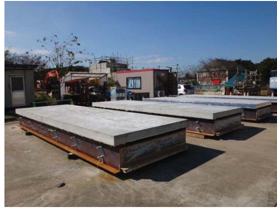
デッキスラブ試験体