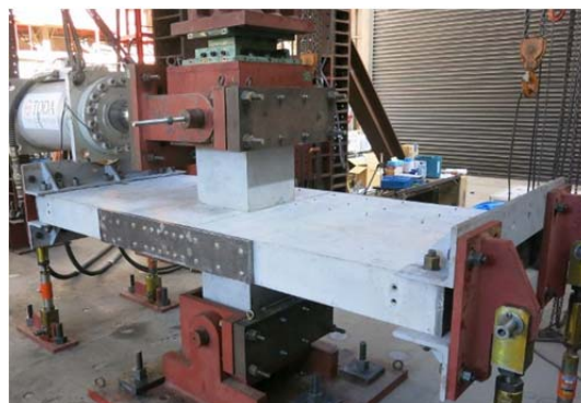
写真1 構造実験状況