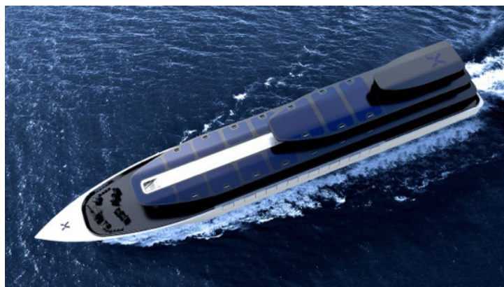
電気運搬船のイメージ図

電気運搬船は、船に搭載した蓄電池に蓄電し、電気を海上輸送するという世界初の送電手段です。我が国は2050年までにカーボンニュートラルの達成を目標に掲げ、洋上風力については排他的経済水域(EEZ)まで広げる検討を含め、積極的な再生可能エネルギーの導入が行われています。日本の海域の水深は深く、特にEEZではこれまでの送電手段で送電が可能な水深300m以下の水域は約10%であることから、送電手段の強化が課題の一つとなっています。そこで、電気運搬船はこれらの課題の解決手段として可能性が期待されています。