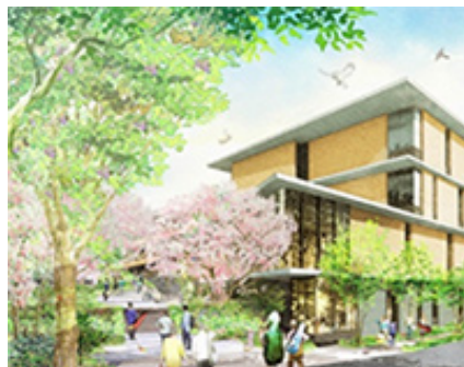
東京音楽大学「みどりの鎌倉街道」完成イメージ