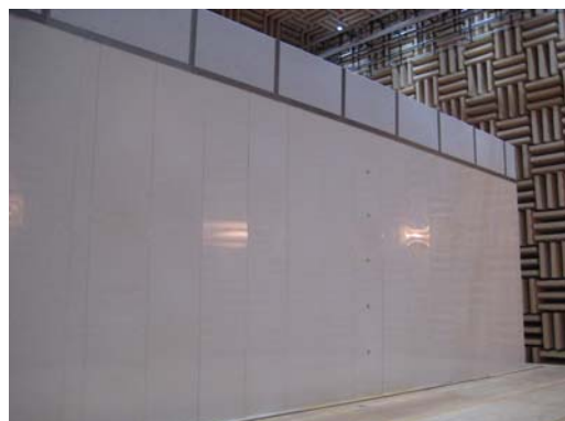
写真4 屋内実験状況