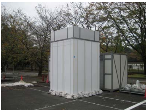
写真3 屋外実験状況

建設工事における騒音対策は非常に重要な問題となっており、より良い騒音低減効果を持つ防音壁が求められている一方で、景観、日照、安全性、設置コスト等の観点から高さを抑えることも望まれています。今後は工事現場で発生する騒音の低減や、屋外に設置される設備機械等から発生する騒音の低減対策にも利用し、周辺環境にやさしい技術として積極的に展開する予定です。