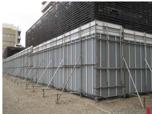
写真2 建設現場適用状況