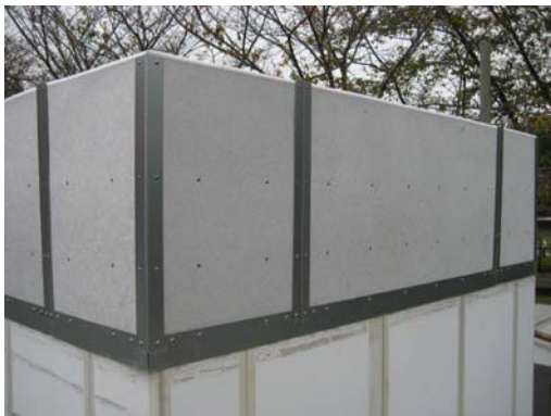
写真1 エッジサイレンサー

今後は建設現場で発生する騒音の低減に加え、屋外に設置される設備機械等から発生する騒音の低減対策にも利用し、周辺環境にやさしい技術として積極的に展開する予定です。