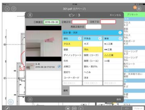
指摘内容入力画面