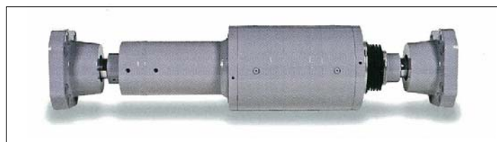
写真2 制振ダンパー姿図