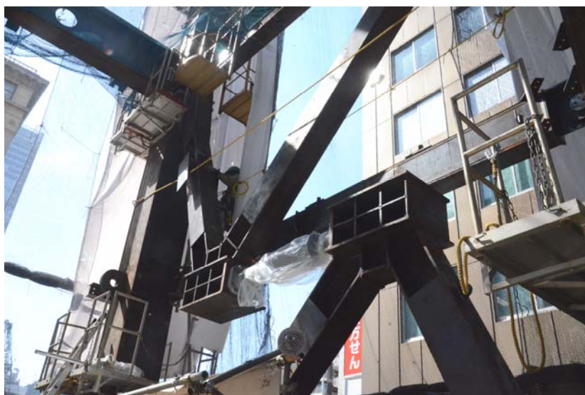
写真1 制振ダンパー設置状況