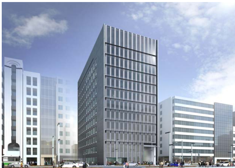
図 1 京橋イーストビル外観パース

※レントラブル比・・・延床面積に占める収益部分の面積比率のこと。レントラブル比が大きいほど収益性は高くなる。